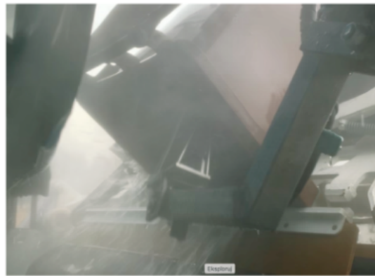
△ Ramię głowicy myjącej myjki podczas czyszczenia pojemników 120 litrów