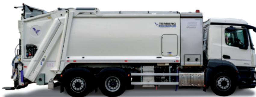
△ Śmieciarko-myjka KOMUNAL WASH z zabudową Terberg

Wśród najważniejszych elementów zastosowanego systemu są zbiorniki na wodę. Stanowią one niezależną konstrukcję, zamontowaną na ramie pomocniczej między zabudową śmieciarki a kabiną. Zbiornik na czystą wodę o pojemności 2.000 litrów jest przystosowany do montażu układu podgrzewającego (opcja), zapewniającego jeszcze wyższą skuteczność mycia. Pod zbiornikiem czystej wody znajduje się zbiornik na wodę brudną, którego pojemność wynosi 800 litrów. Jest on wyposażony w duży łatyw w czyszczeniu właz. Oba zbiorniki są wykonane