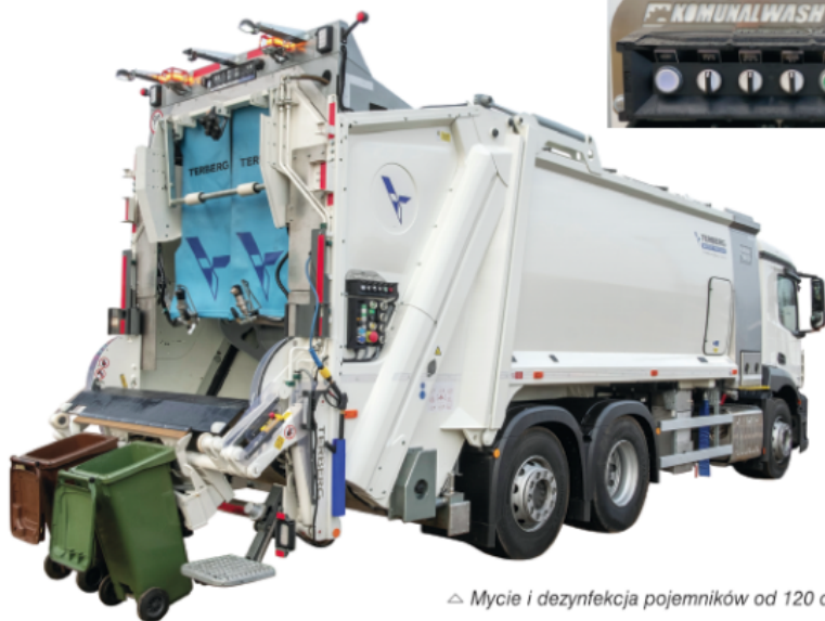
△ Mycie i dezynfekcja pojemników od 120 do 1100 litrów

do bocznych ścian odwłoka. Po opróżnieniu pojemnika elementy robocze wychylają się w kierunku jego wnętrza i rozpoczyna się proces mycia. Zastosowana technologia gwarantuje umycie każdego zakątka. Ponadto dostępne są tzw. dysze Turbo, których ustawienie i siła oddziaływania pozwala na skuteczne doczyszczenie dna pojemnika. Brudna woda razem z nieczystościami spływa na dno wanny odwłoka, a następnie – poprzez dwustopniowy separator – trafia do specjalnego kanału. Dopiero po jego wypełnieniu jest przepompowana do umieszczonego za kabiną zbiornika wody brudnej. Standardowy czas mycia pojemników wynosi 6, 12, 18 lub 24 sekundy, ale na życzenie użytkownika można zaprogramować inne cykle.