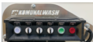
▽ Pulpit sterowniczy