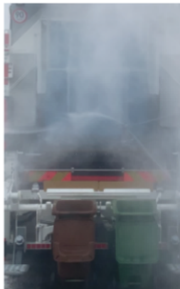
△ Ciśnienie wody do 150 bar

System KOMUNAL WASH charakteryzuje się nieskomplikowaną budową, gwarantując odpowiednią trwałość i niezawodność. Ponadto ma prostą zasadę działania i łatwo z niego korzystać. Woda ze zbiornika na czystą wodę trafia grawitacyjnie przez filtr do pompy wysokociśnieniowej (uruchamianej dopiero po wybraniu funkcji mycia), skąd jest doprowadzana do głowic rotacyjnych lub dysz myjących. Głowice są umieszczone na ruchomych ramionach zamocowanych