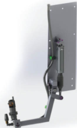
△ Ramiona z głowicami myjącymi ▽ oraz dyszami „Turbo”