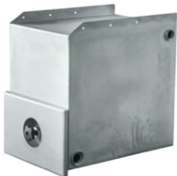
△ Zbiornik na odcieki (od 125 do 200 l)